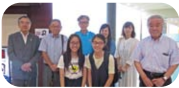
～高知龍馬空港出発～