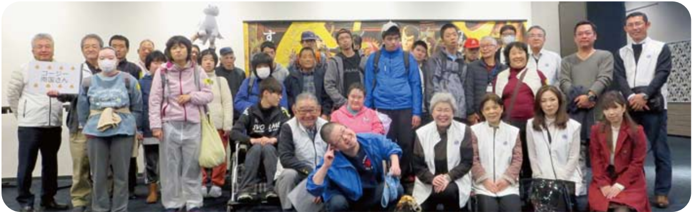
コージー南国の皆さんと

終了後には参加者の方々からは、「おもしろかった!」「ありがとう!!」とたくさんの感謝の言葉と笑顔をいただき、お世話をさせていただいたこちらにも本当に嬉しい気持ちになりました。